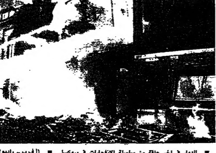
الدمار في آخر حطلة من سلسلة الانفجارات في بروكسل

ذكرت الشرطة البلجيكية أن شخصاً لقي مصرعه وخشى أن يكون شخصان قد قتلوا أيضاً في سلسلة من انفجارات الغاز سببها برودة الطقس وقعت في أربعة منازل في غرب بروكسل في وقت مبكر من صباح أمس. وبذلك يصل عدد القتلى في الانفجارات التي وقعت خلال اليومين الماضيين إلى ثلاثة أشخاص. وقد أدى انفجار وقع أمس في جرح سبعة أشخاص منهم طفل أصيب بجروح خطيرة. وقالت الشرطة أن اللجنة التي تم انتدابها من الحكومة أمس كانت مصابة بجروح كثيرة حتى أنه استحال التعرف